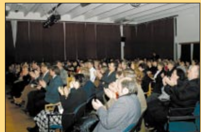
Teltház volt délelőtt és délután is