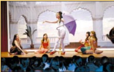
Az előadás egy mozzanata